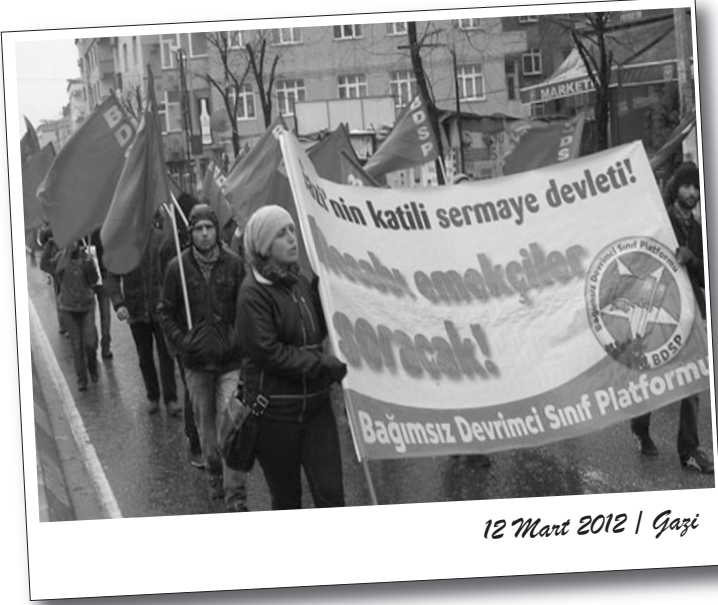
12 Mart 2012 | Gazi

Sermaye devletinin kanlı katliamlarından biri olarak tarihe geçen Gazi Katliamı'nın 17. yıldönümünde bir kez daha alanlara çıkan devrimci ve ilerici güçler ile şehit aileleri anma etkinlikleri ve yürüyüşler gerçekleştirerek katliamdan hesap sorma çağrısında bulundular. Soğuk hava ve yağmura rağmen binlerce kişinin katıldığı eylemlerde katliamcı devlete yönelik öfke öne çıktı.