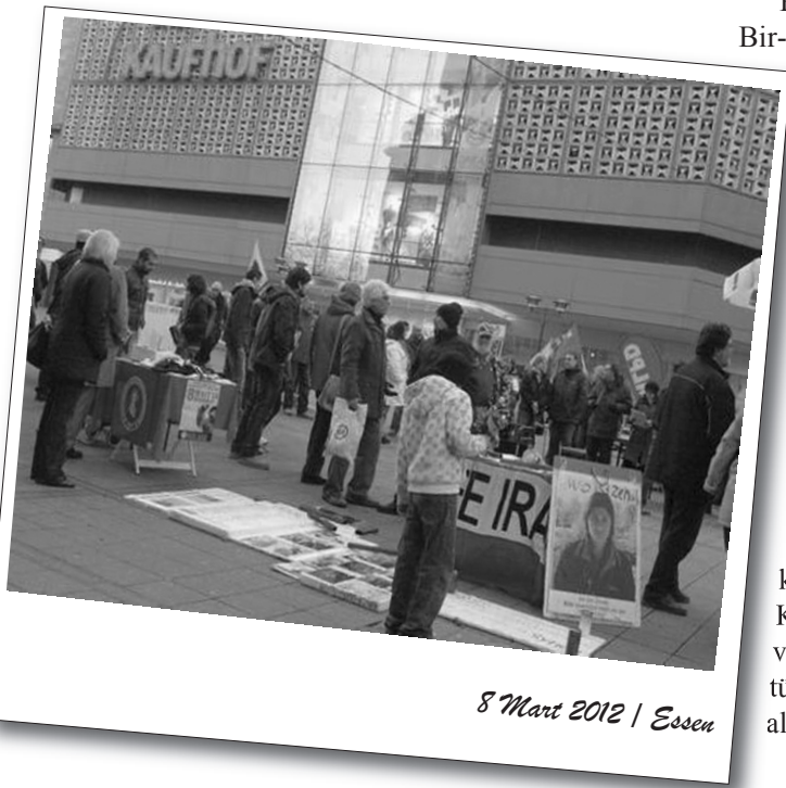
8 Mart 2012 | Essen

8 Mart Dünya Emekçi Kadınlar Günü, Avrupa'nın çeşitli ülkelerinde gerçekleştirilen eylem ve etkinliklerle kutlandı.