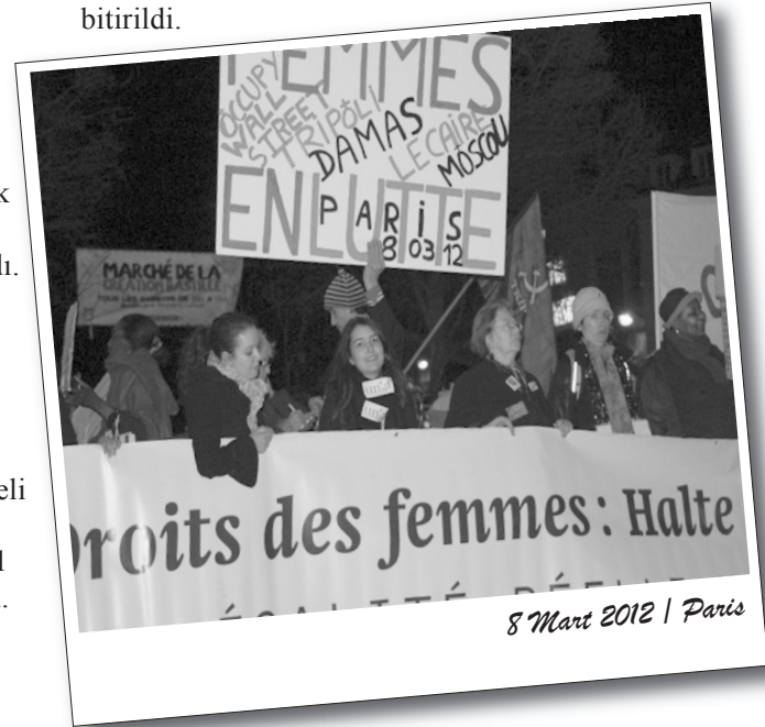
8 Mart 2012 | Paris

Konuşmadan sonra "Yaşamın yarısından kavganın yarısına" başlıklı sinevizyon gösterimine geçildi. Bunu, slayt eşliğinde Tanya şiirinin okunması izledi. Etkinlik son olarak müzik dinletisiyle bitirildi.