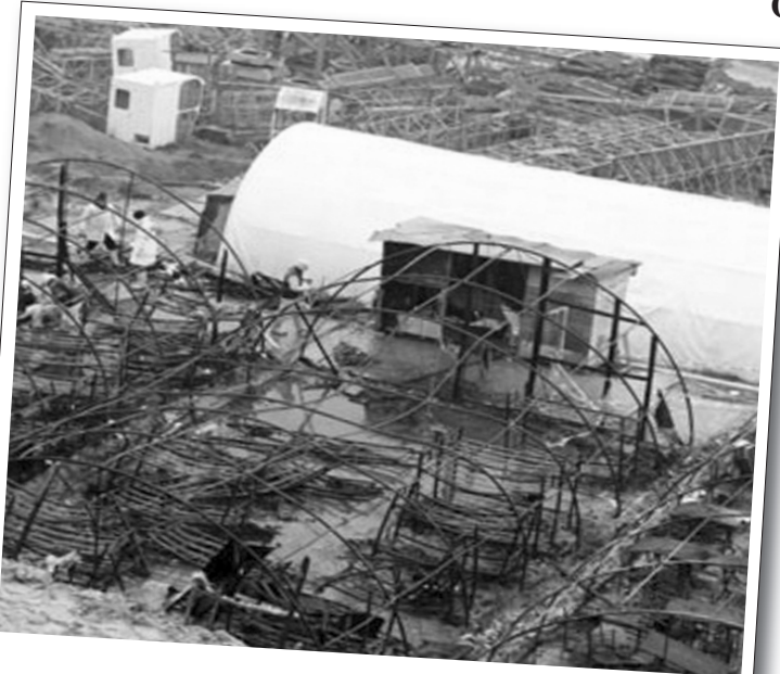
11 Mart 2012 | İstanbul